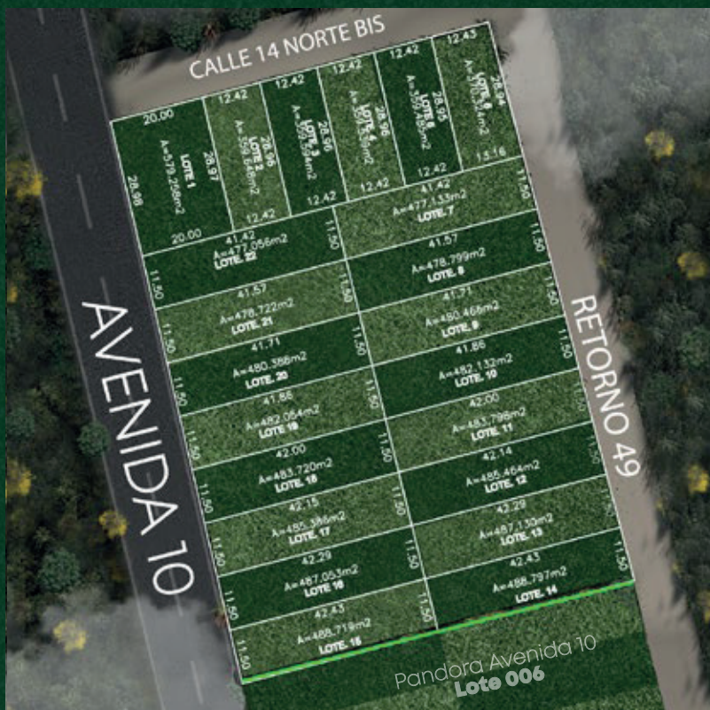
Pandora Avenida 10- Lote 001