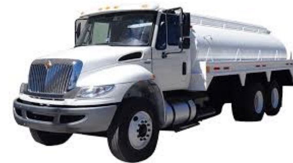
PIPAS INTERNACIONAL CAPACIDAD: 10,000 LITROS