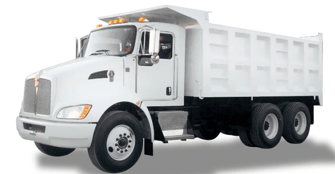
VOLQUETES CAPACIDAD 14 M 3