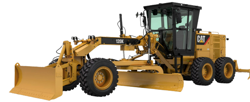
MOTOCONFORMADORAS MODELO 120 K