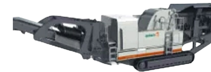
TRITURADORA DE IMPACTO MARCA: METSO