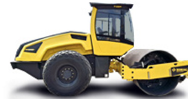
VIBROCOMPACTADORAS 10 TONELADAS